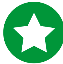
Kompetente og motiverte medarbeidere