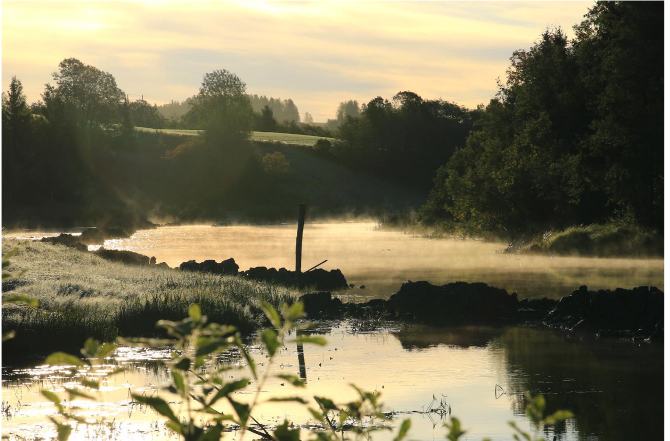
Motiv: Nitelva ved Åros bru.